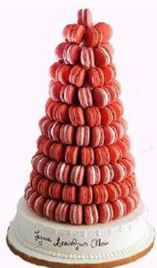
Pyramide de macarons