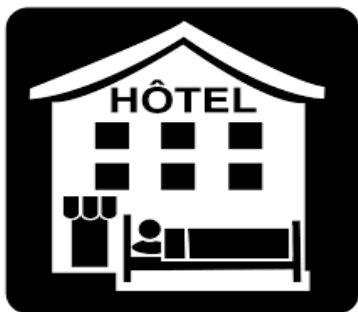
Partenariat avec des hôtels