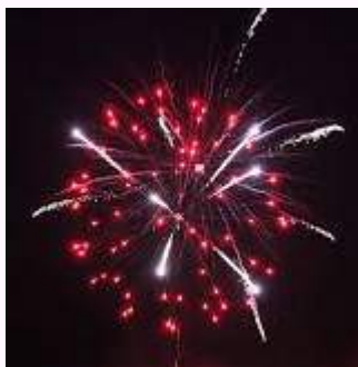
Boîte à tirer 4minutes (feu artificiel) 250€