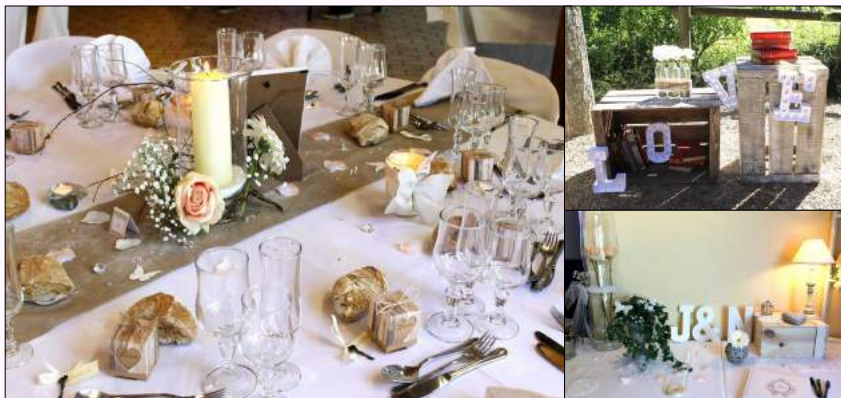
Partenariat avec une décoratrice.