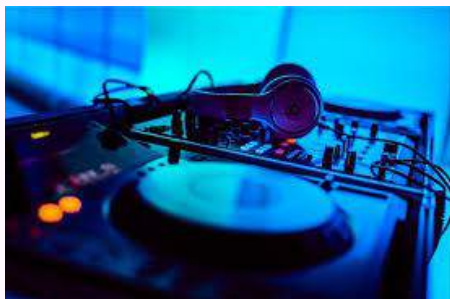
Partenariat avec DJ