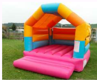
Structure gonflable : (possibilité plus grandes structures) 6 enfants environ à partir de 3 ans, tarif à partir de : 200€