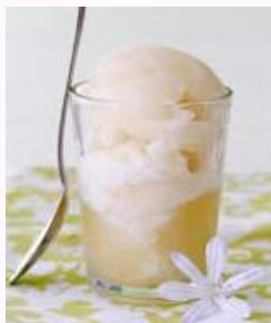
Trou normand : 3,50€