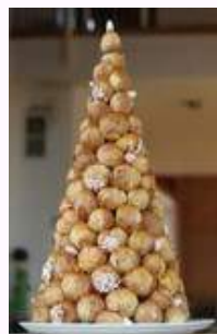
Pièce montée choux vanille :